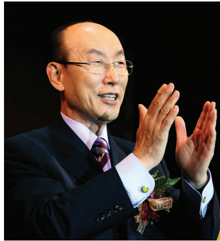
DCEM 총재 조용기 목사

“우리 살아 있는 자가 항상 예수를 위하여 죽음을 넘겨짐은 예수의 생명이 또한 우리 죽을 육체에 나타나게 하려 함이라 그러즉 사망은 우리 안에서 역사하고 생명은 너희 안에서 역사하느니라” <고린도후서 4장 11~12절>